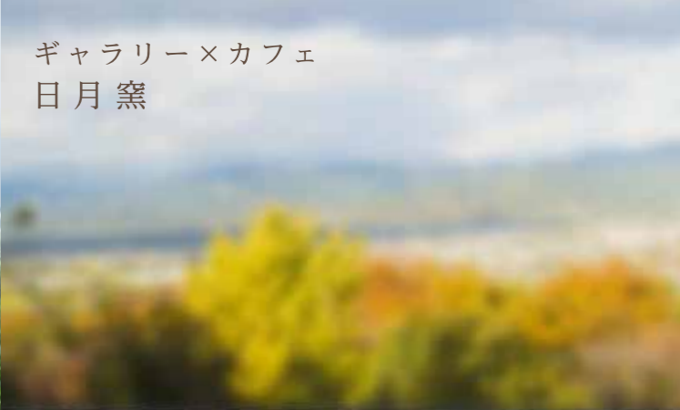
ギャラリー×カフェ 日月窯